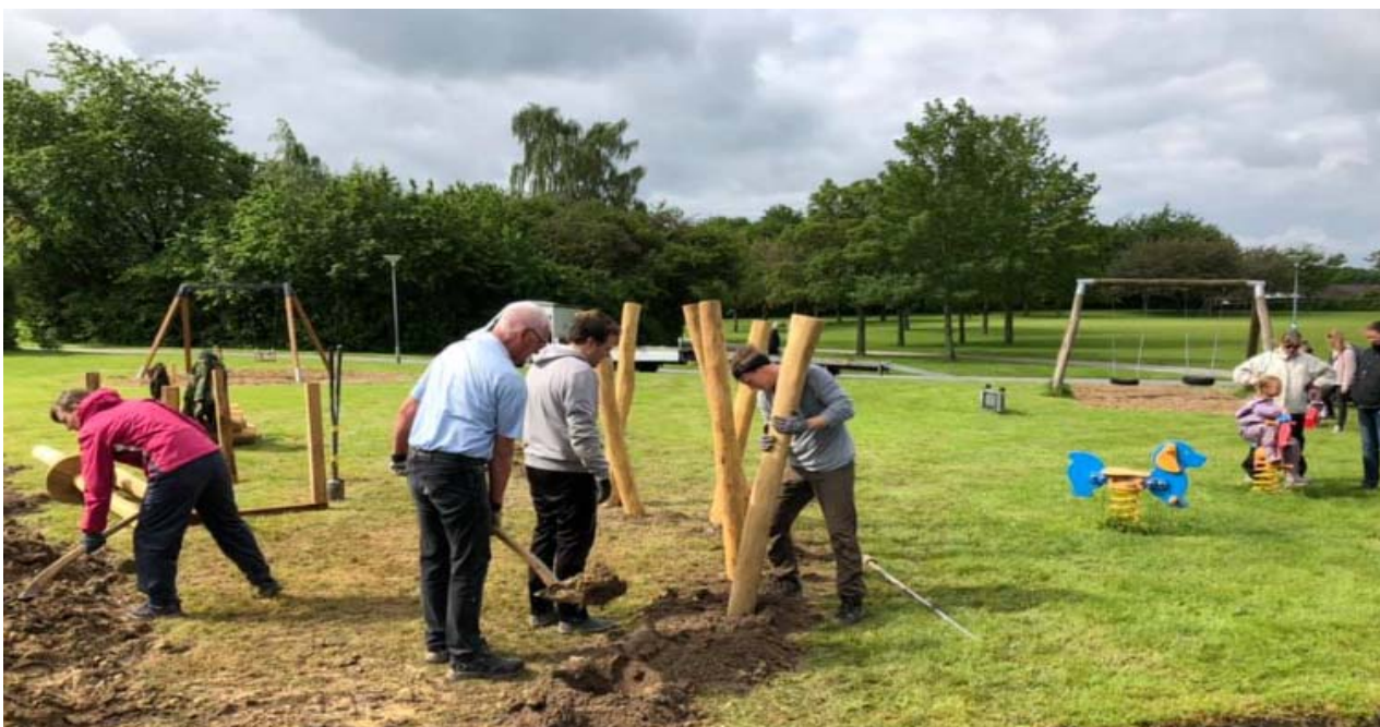
Parkourbanen anlægges i samarbejde med leverandøren og frivillige hjælpere